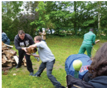
Epreuve du tas de bois

Chaque année, le trophée (copie d'une réalisation de RODIN) est remis en jeu. L'établissement qui gagne le trophée a en charge d'organiser la manifestation l'année suivante. Trois à quatre réunions annuelles sont nécessaires à l'organisation de cette finale. Le partenariat s'installe et chaque établissement construit une épreuve en lien avec le thème retenu. Professionnels et usagers apportent ainsi leurs contributions. Les équipes constituées de 6 usagers et 2 professionnels s'affrontent autour de 5 épreuves.