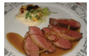
Repas servi à la Brasserie

Nous avons déjeuné à la Brasserie. Les repas ont été préparés et servis par des élèves. ■